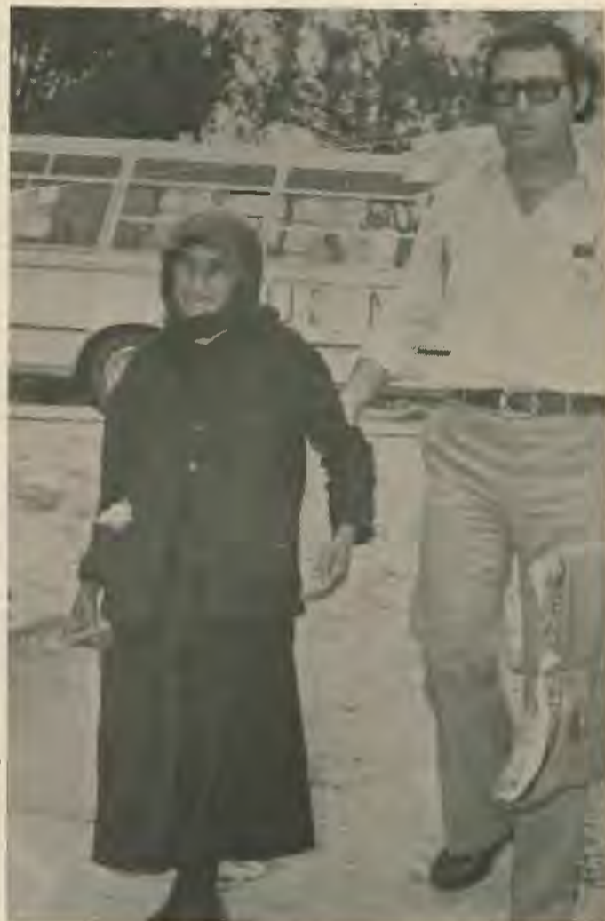
Τη στιγμή που κερδίσαμε το ψήφισμα οι ξεριζωμένοι Κυπρίων συνεχίζονται και...